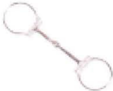
Filetto Con anello a D

Quando si utilizza un filetto/snaffle bit è obbligatorio montarlo su di una testiera munita di sottogola