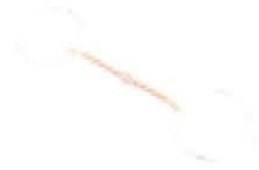
Filetto a Torciglione O-ring

Diametro minimo cannone 8 mm Sono permessi sia anelli rotondi (o-ring), che a "D"