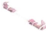
Barbozzale a catena